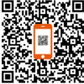
QR-Code für Neuanmeldung

Auf unserer Internetseite erhalten Sie weitere Informationen zur Melde- und Beitragspflicht, zu Beihilfen der Sächsischen Tierseuchenkasse sowie über die Tiergesundheitsdienste. Zudem können Sie, u. a. Ihr Beitragskonto (gemeldeter Tierbestand der letzten 3 Jahre), erhaltene Beihilfen, Befunde sowie eine Übersicht über Ihre bei der Tierkörperbeseitigungsanstalt entsorgten Tiere einsehen. Sächsische Tierseuchenkasse Anstalt des öffentlichen Rechts Löwenstr. 7a, 01099 Dresden Telefon: +49 351 80608-30 E-Mail: beitrag@tsk-sachsen.de Internet: www.tsk-sachsen.de